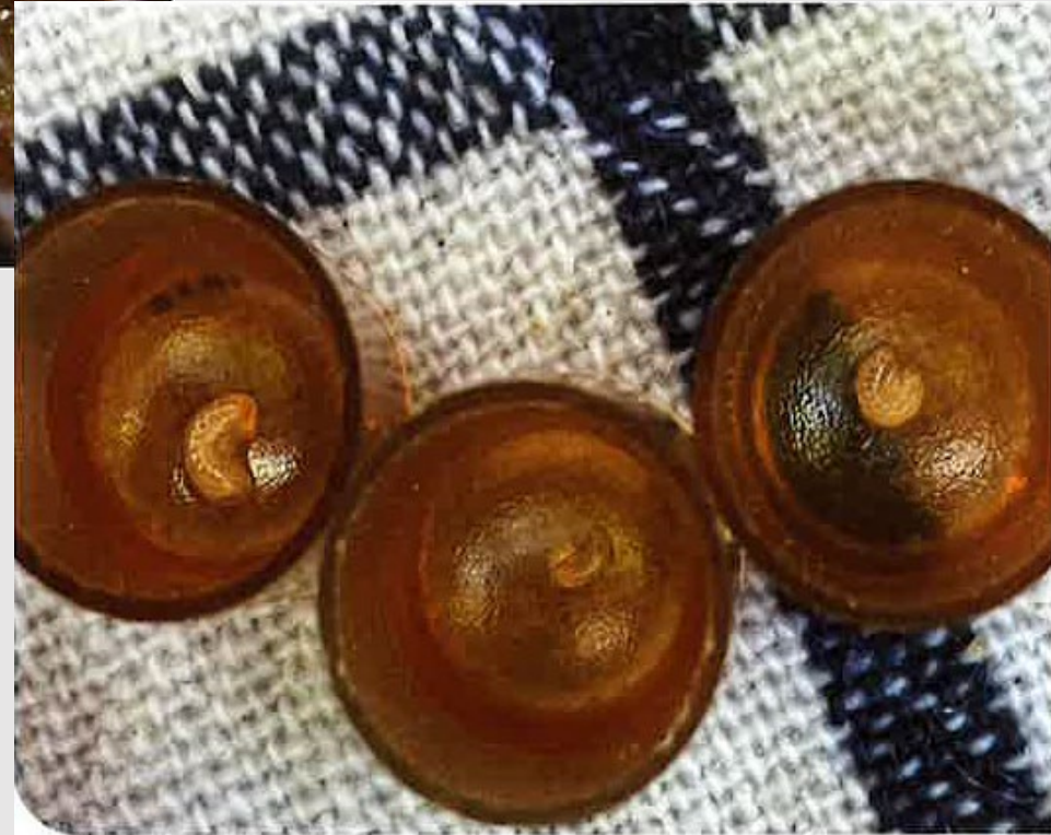
Die perfekte Larve